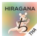
タイ語版 Thai Version