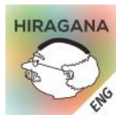
英語版 English Version